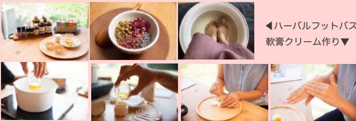
◀ハーバルフットバス 軟膏クリーム作り▼