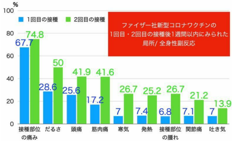
ファイザー社の新型コロナワクチンを接種した後の、1回目と2回目の副反応の頻度 (CDC. COVID-19 vaccine safety update. January 27, 2021)

A 注射した場所の痛み、だるさ、頭痛、筋肉痛などの反応が出ることが多いです。インフルエンザワクチンと比べると出る頻度は高いです。