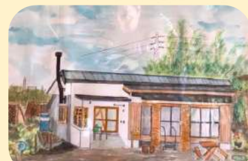
2020年3月患者様からの寄贈