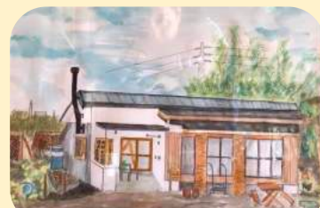
2020年3月患者様からの寄贈

ココロまち診療所で働きたい！看護師さん・事務職員さん募集中です！詳細はお電話にてお問い合わせください。